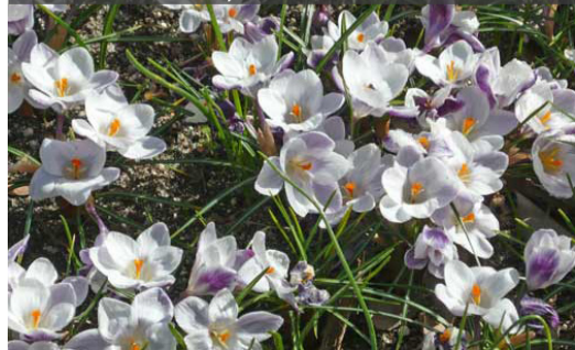
17. CROCUS chrysanthus - Crocus

Planter à une profondeur égale à deux fois la hauteur du bulbe. Retirer les feuilles lorsqu'elles jaunissent et sèchent.