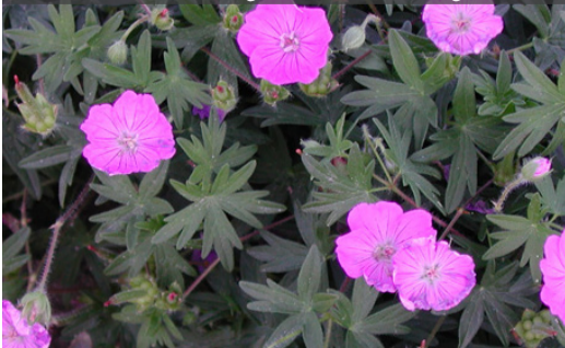
14. GERANIUM sanguineum - Bec de grue

Raccourcir les tiges après chaque floraison pour favoriser une nouvelle végétation. Tailler en petites touffes en fin d'hiver.