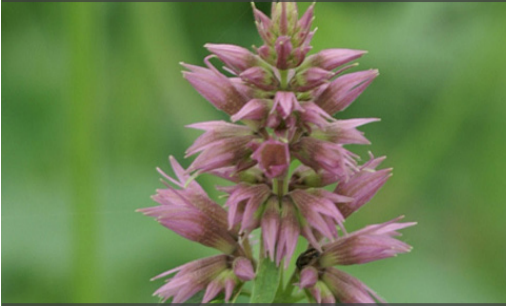
1. AGASTACHE 'Ayala' - Agastache

Supprimer les fleurs fanées pour prolonger les floraisons. Rabattre en fin d'automne dès que la touffe n'est plus décorative et protéger en régions très froides.