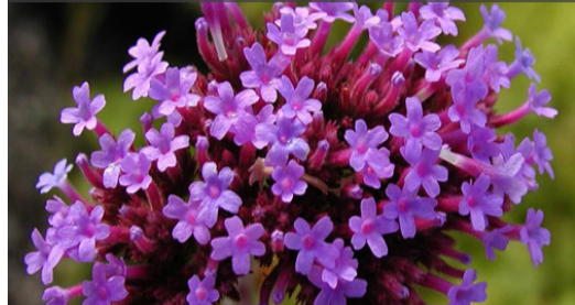
4. VERBENA bonariensis - Verveine de Buenos Aires

Supprimer les fleurs fanées pour prolonger les floraisons. Conserver celles de fin de saison qui, sèches, resteront décoratives l'hiver. Limiter les semis spontanés si nécessaires. Il est préconisé un paillage sec.