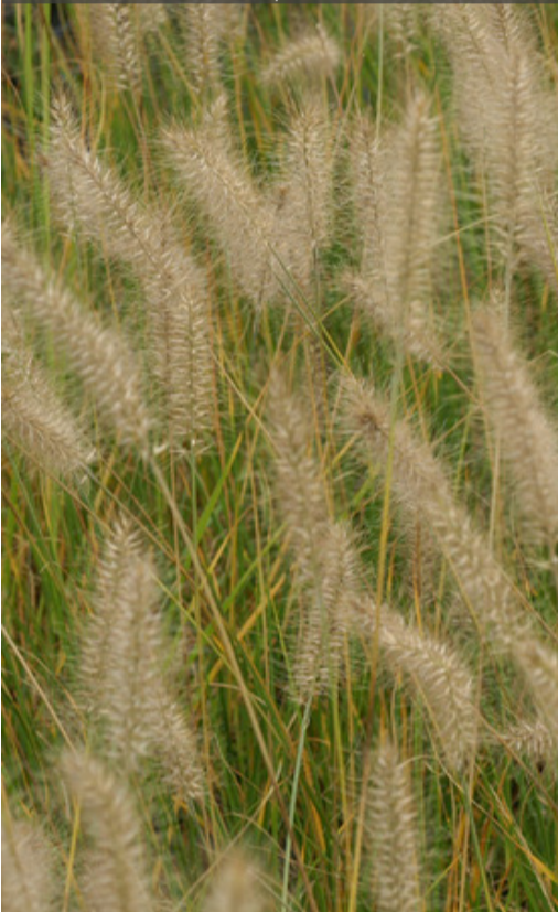
7. PENNISETUM alopecuroides 'Hameln'

Rabattre la touffe sèche au plus tard en fin d'hiver.