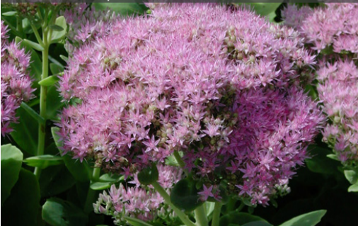
12. SEDUM spectabile 'Carmen' - Sédum

Conserver les inflorescences qui restent belles longtemps. Rabattre la touffe lorsqu'elles ne sont plus décoratives, au plus tard en fin d'hiver.