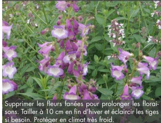
8. PENSTEMON 'Alice Hindley' - Galane

Supprimer les fleurs fanées pour prolonger les floraisons. Tailler à 10 cm en fin d'hiver et éclaircir les tiges si besoin. Protéger en climat très froid.