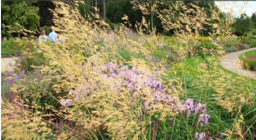
3. STIPA gigantea - Stipe

Les chaumes et inflorescences donneront le relief et graphisme au massif en hiver et se décoreront les jours de givre. Retirer les parties sèches dès qu'elles ne sont plus décoratives et peigner la touffe en fin d'hiver.