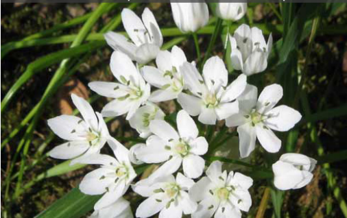
16. ALLIUM neapolitanum - Ail de Naples

Planter à une profondeur égale à deux fois la hauteur du bulbe. Retirer les feuilles lorsqu'elles jaunissent et sèchent.