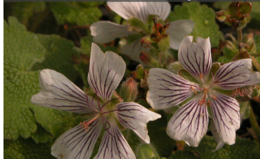
13. GERANIUM renardii - Bec de grue

Pratiquement sans entretien. Nettoyer les parties sèches en fin d'hiver.