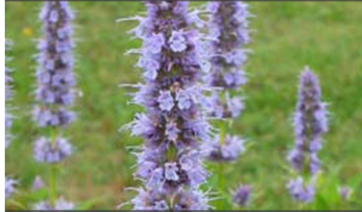
2. AGASTACHE 'Blue Fortune' - Agastache

Supprimer les fleurs fanées pour prolonger les floraisons. Rabattre en fin d'automne dès que la touffe n'est plus décorative et protéger en régions très froides.