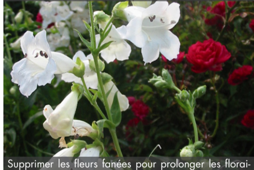
9. PENSTEMON 'White Bedder' - Galane

Supprimer les fleurs fanées pour prolonger les floraisons. Tailler à 10 cm en fin d'hiver et éclaircir les tiges si besoin. Protéger en climat très froid.