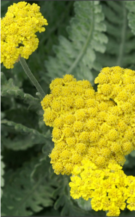
5. ACHILLEA 'Moonshine' - Achillée

Supprimer les fleurs fanées pour prolonger les floraisons. Rabattre dès que la touffe n'est plus décorative.