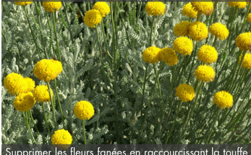
11. SANTOLINE chamaecyparissus - Santoline

Supprimer les fleurs fanées en raccourcissant la touffe en fin de floraison. Tailler court en fin d'hiver pour éviter que les tiges noirissent à la base et s'écrasent lors de la floraison.