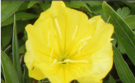
15. OENOTHERA macrocarpa - Oenothère

Couper les fleurs fanées et raccourcir les tiges pour prolonger les floraisons. Rabattre les parties sèches dès qu'elles ne sont plus décoratives.