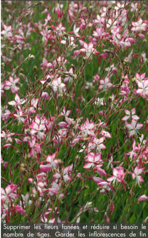
6. GAURA lindheimeri 'Rosyjane'® - Gaura

Supprimer les fleurs fanées et réduire si besoin le nombre de tiges. Garder les inflorescences de fin de saison qui sèches, resteront décoratives en hiver. Rabattre la touffe en fin d'hiver.