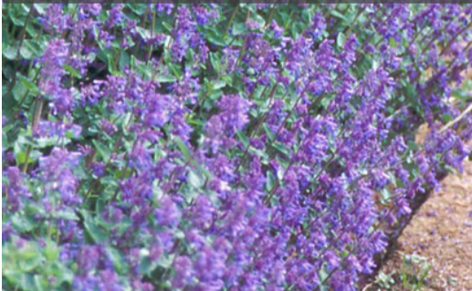
10. NEPETA 'Six Hills Giant' - Menthe des chats

Après la floraison, rabattre la touffe qui donnera vite une nouvelle végétation et floraison. Couper le feuillage sec en fin d'automne.